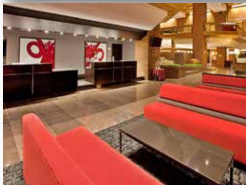
N.B.: Many pictures were provided by TripAdvisor. Plusieurs photos de Gatineau et d'Ottawa sont fournies gracieusement par TripAdvisor.

Why not plan your journey right now to get to the conference? Early air or train reservation will allow you to benefit from a better fare and by the same token do more with your 'conferences, seminars, and colloquiums' 2018 budget.