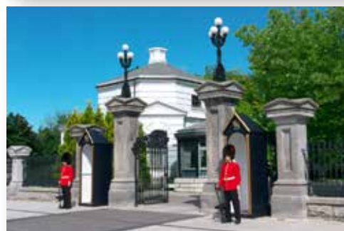
N.B.: Many pictures were provided by TripAdvisor. Plusieurs photos de Gatineau et d'Ottawa sont fournies gracieusement par TripAdvisor.